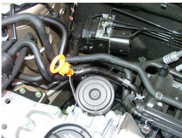
ŠKODA FABIA 1,2i