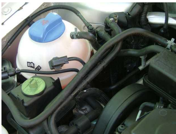
ŠKODA OCTAVIA 1,6i

Upozornenie: na spotrebu má významný vplyv zmena vlhkosti vzduchu, poveternostné podmienky, zmena adhézie vozovky, pneumatík, typ a kvalita použitého paliva, spôsob jazdy, celkový technický stav vozidla.